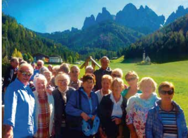
Vier lehrreiche, interessante aber auch genussvolle und lustige Tage in Südtirol verbrachten die Teilnehmer der Jubiläumsfahrt.

Die Abgeordnete des Südtiroler Landtages und Vorstandsmitglied der „Südtiroler in der