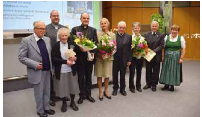
Ehrungen für jahrzehnte lange Tätigkeit als Pfarrhaushälterin