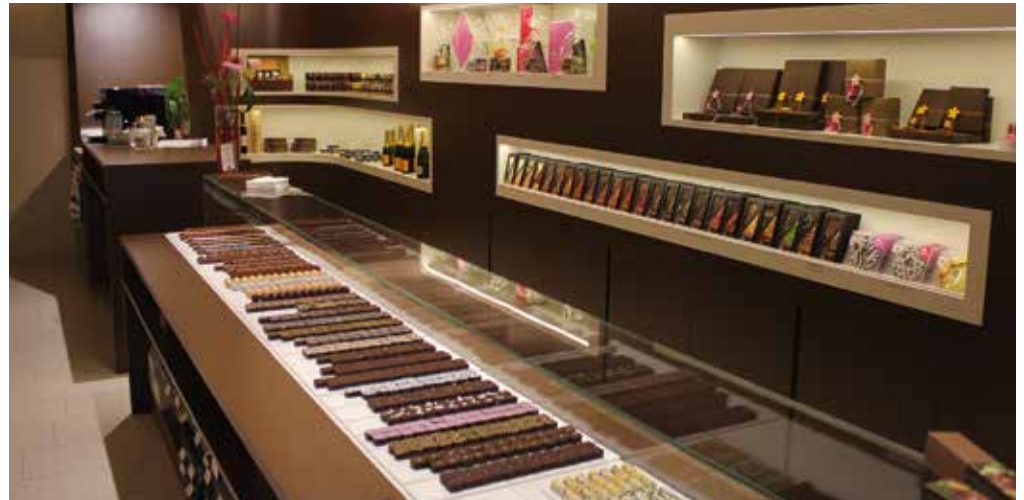
Oben: die Patisserie in Bozen Rechts: Patisserie und Blumen: das Geschäft in Bruneck Macarons Schokoladentorte

Es ist die Philosophie und das Markenzeichen der beiden innovativen Unternehmer, ein ehrliches Produkt auf höchstem Niveau entstehen zu lassen. Die Freude und Motivation der beiden Unternehmer werden so zu verführerischen Kreationen. 2000 haben sie sich kennen ge-