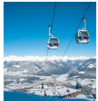
Platz eins für den Kronplatz

Der Kronplatz ist das beste Skigebiet Europas. Das ergab die Studie „Best Ski Resorts“, für die 46.000 Wintersportler befragt wurden.