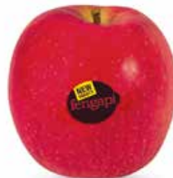
Neuer Apfel

Seit knapp 20 Jahren widmet sich die Feno mit Sitz in Neumarkt der Entwicklung und Verwaltung von Obstsorten. Mit fengapi gelang zuletzt die Züchtung einer neuen Apfelsorte: es ist eine Kreuzung zwischen Gala und Pink Rose. Der Apfel ist leuchtend rot und im Geschmack süß, mit niedriger Säure, das Fruchtfleisch ist knackig, saftig und fest.