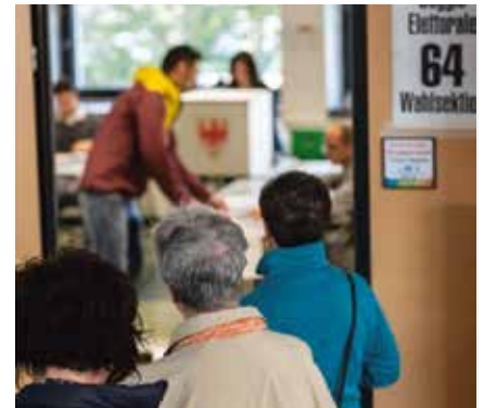
Die Wahlbeteiligung bei den Landtagswahlen sank auf 73,9 Prozent (2013: 77,7 %)

Die Südtiroler Volkspartei hat zwar 3,8 Prozentpunkte verloren, sie bleibt aber mit Abstand stimmenstärkste Partei. In der kommenden Legislatur sitzen zwei Ab-