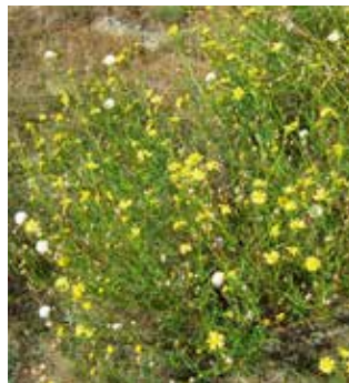
Das südafrikanische Greiskraut

Eine Ausreiß-Aktion gegen das invasive südafrikanische Greiskraut hat die Forststation Jenesien mit der Gemeinde und Schülerinnen und Schülern organisiert. Die bisherigen Erfahrungen haben gezeigt, dass das Ausreißen der Pflanzen die wirksamste Methode ist, um die betroffenen Flächen von Greiskraut zu säubern. Die aus Südafrika stammende invasive Pflanze verbreitet sich rasch auf brachliegenden Flächen. Dies hat negative Auswirkungen: Die Giftstoffe des Greis-